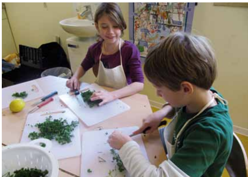
Im Kinderhaus Lübeck schnibbelten Mädchen und Jungen fleißig Kräuter und Kartoffeln

Die „Kinderküche auf Tour“ des Kinderschutzbundes besucht Kinder in Hort-Einrichtungen verschiedener Träger, Schulen oder DKSB-Kinderhäusern. Der Kastenwagen der „Kinderküche auf Tour“ ist ausge-