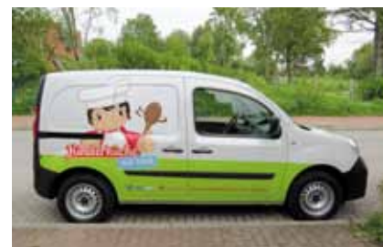
Der Kastenwagen der Kinderküche auf Tour

Mit großem Erfolg nahm die „Kinderküche“ auch an den „Geschmackstagen“ im Kieler Sophienhof teil.