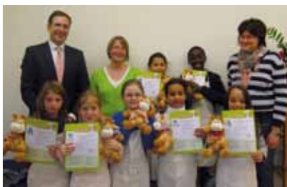
Kinderküche auf Tour: als Abschluss werden den kleinen Teilnehmern des Kinderhauses Lübeck Urkunden überreicht.

Der Sparkassen- und Giroverband SH lud zum Partner- und Medienempfang